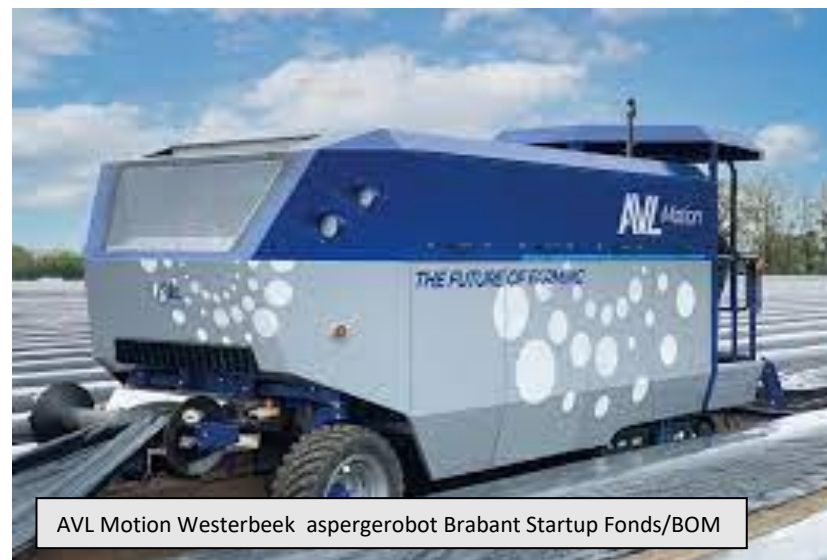
AVL Motion Westerbeek aspergerobot Brabant Startup Fonds/BOM

In 2021 hebben we samen met de provincie Noord Brabant, REWIN West-Brabant, Brainport Development, en de Brabantse Ontwikkelings Maatschappij een agenda met samenwerkingsafspraken opgezet voor innovatie in de voedselketen. Doel van deze innovatieagenda is om het