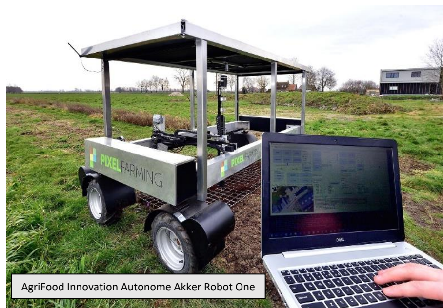
AgriFood Innovation Autonome Akker Robot One

We gaan er vanuit dat dierlijke eiwitten onderdeel blijven uitmaken van ons dieet. Maar dan wel zo duurzaam mogelijk geproduceerd. Doel van dit project is het uitvoeren van een haalbaarheidsonderzoek en het zetten van de eerste stappen tot de verdere uitwerking van een ontwikkel- en expertisecentrum voor duurzame eiwitten (ODE), dat moet bijdragen aan de verdere verduurzaming van de veehouderij. We richten ons in eerste instantie op de varkenshouderij en daarmee de plaats van het varken in de kringloop. Onderzocht wordt een kennisinfrastructuur met gecombineerde mogelijkheden van een: belevingscentrum, high tech flexibele onderzoeksruimte-/faciliteit, en een expertisecentrum. De stuurgroep wordt