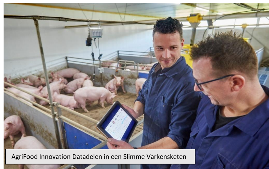
AgriFood Innovation Datadelen in een Slimme Varkensketen

Herkenning en erkenning zijn belangrijke aspecten van succesvolle regionale ecosystemen. Aan de basis hiervoor ligt een goede communicatiestrategie. Extra aandacht gaat uit naar de verhalen van onze voedselmakers en public affairs. Daarmee positioneren we AgriFood Capital als ecosysteem voor de makers van ons voedsel van vandaag en morgen.