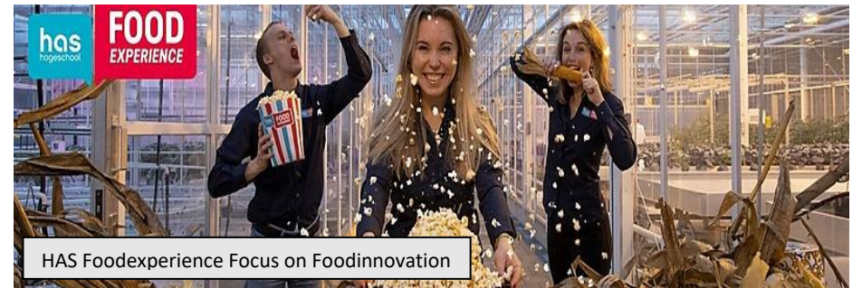
HAS Foodexperience Focus on Foodinnovation

HAS Food Experience toont vernieuwende oplossingen voor uitdagingen in food en foodsystemen voor vandaag én morgen, bedacht en ontwikkeld door 4 e jaars HAS studenten. Samen met Albert Heijn, Rabobank, Vion, Marel, Appèl en Royal Swinkels Family Brewers is AgriFood Capital ambassadeur van HAS Food Experience. We stimuleren actief de verbinding tussen deze studenten en het omvangrijke agrifood-ecosysteem in Noordoost-Brabant. Meer info: HAS Food Experience