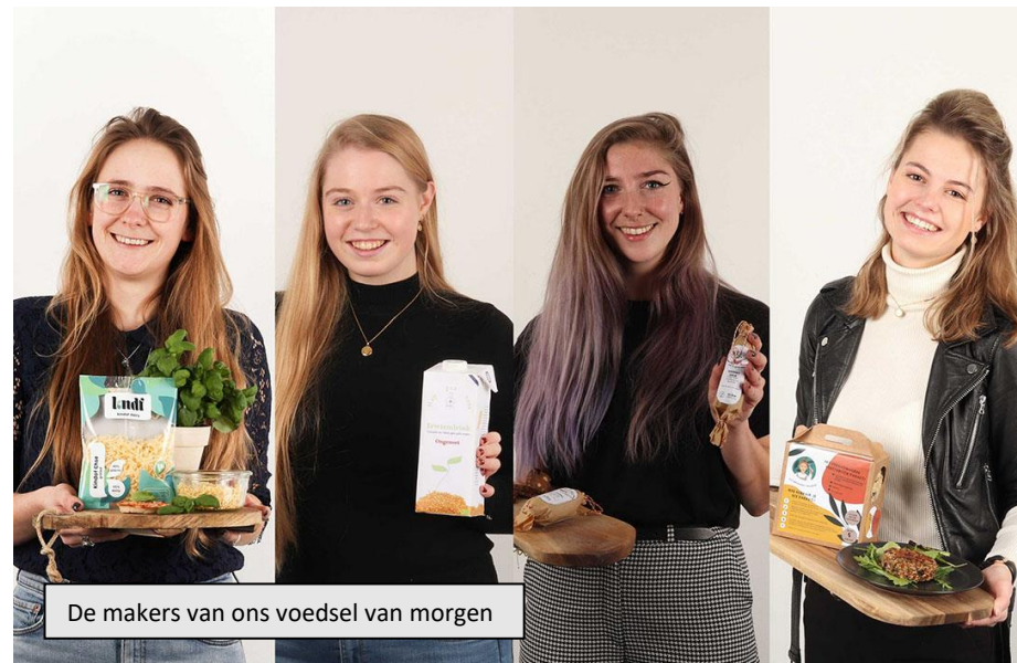
De makers van ons voedsel van morgen