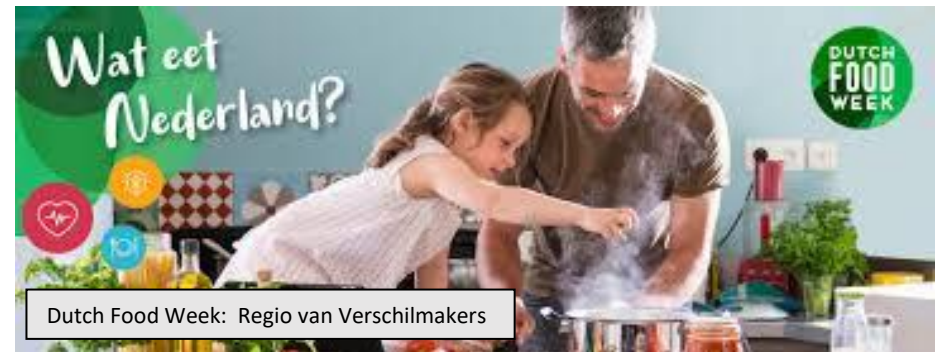
Dutch Food Week: Regio van Verschilmakers