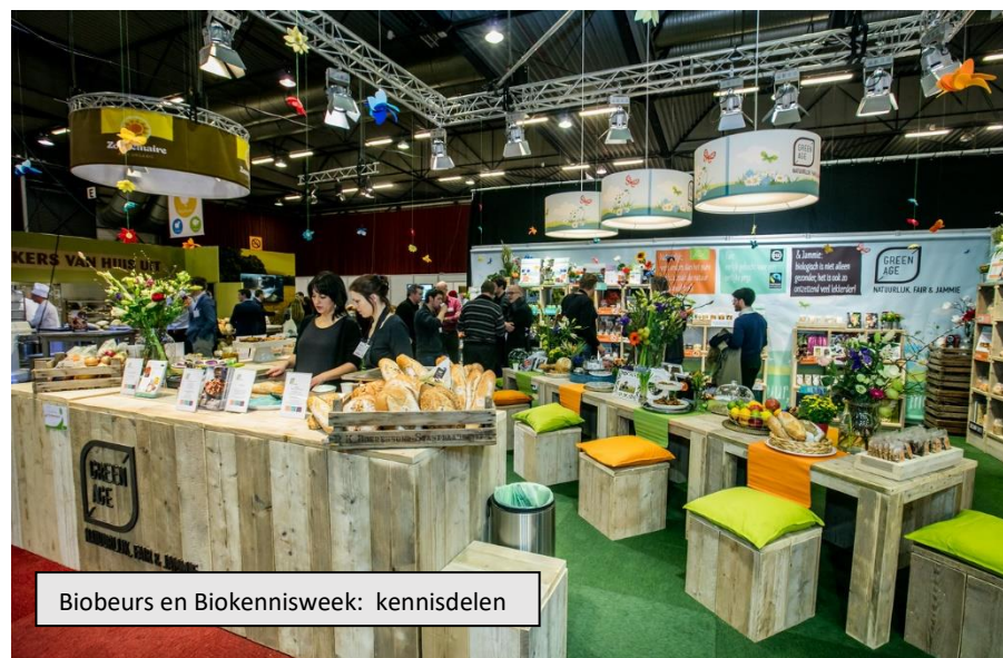
Biobeurs en Biokennisweek: kennisdelen