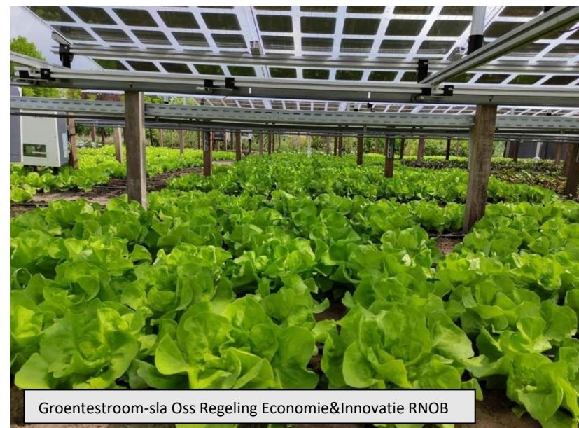
Groentestroom-sla Oss Regeling Economie&Innovatie RNOB