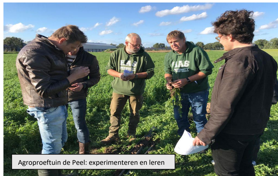
Agroproeftuin de Peel: experimenteren en leren