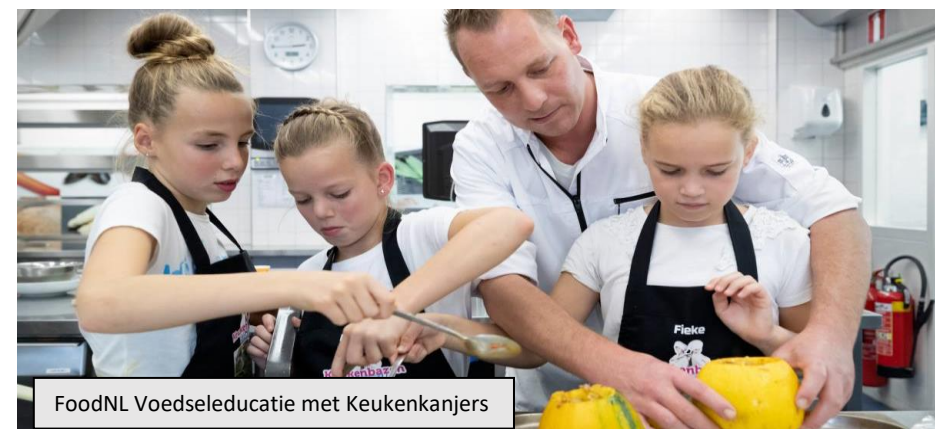
FoodNL Voedsel educatie met Keukenkanjers

Drie Nederlandse voedselregio's, Greenport Regio Venlo, AgriFood Capital Noordoost-Brabant en Regio Foodvalley, vormen samen een cluster in Brussel om één krachtige boodschap te kunnen afgeven. Dit gebeurt onder de werknaam Food NL. De prioritaire thema's zijn voeding & gezondheid en eiwittransitie. Tot op heden hebben we breed ingezet op bestuurlijke en hoog ambtelijke netwerken in Brussel. We komen nu in de fase dat we, op deze twee thema's, met een gezamenlijk portfolio van projecten uit de 3 regio's en gaan inzetten op financiering uit EU-Fondsen zoals OPZuid en/of LIFE. Daarvoor zal specifieke expertise ingezet gaan worden om de kansrijkheid te