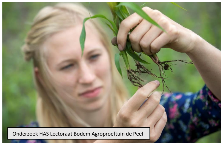
Onderzoek HAS Lectoraat Bodem Agroproeftuin de Peel

De uitdagingen waar bedrijven in de voedselketen de komende jaren voor staan, vertalen zich ook in arbeidsmarkt vraagstukken, zoals de behoefte aan nieuwe kennis en vaardigheden in het bedrijf, toenemende concurrentie op de arbeidsmarkt en anders leidinggeven. Er doen zich in 2022 een aantal mogelijkheden voor, zoals het verzoek vanuit een aantal samenwerkende MBO-scholen (waaronder Yuverta) om te gaan participeren in een investeringsfondsaanvraag, mede voortkomend uit de MBO-samenwerking in Brabant (BEET). De Stichting Ontwikkelingsfonds Levensmiddelenindustrie (SOL) ontwikkelt een programma gericht op transitieopgaven specifiek in de arbeidsmarkt van foodbedrijven en wil dit graag samen met ons organiseren. Daarnaast is de samenwerking tussen HAS en Avans, als voorzetting van de Grow Campus, onder de werknaam 'AgriFood Capital Innoveert' nog immer actueel. Het betreft dan met name het versterken van de relatie met de proeftuinen zoals AgroProeftuin de Peel, het Circulair Food Center en mogelijk The Chocolate Factory in Meierijstad en de ontwikkeling van een Groene Campus.