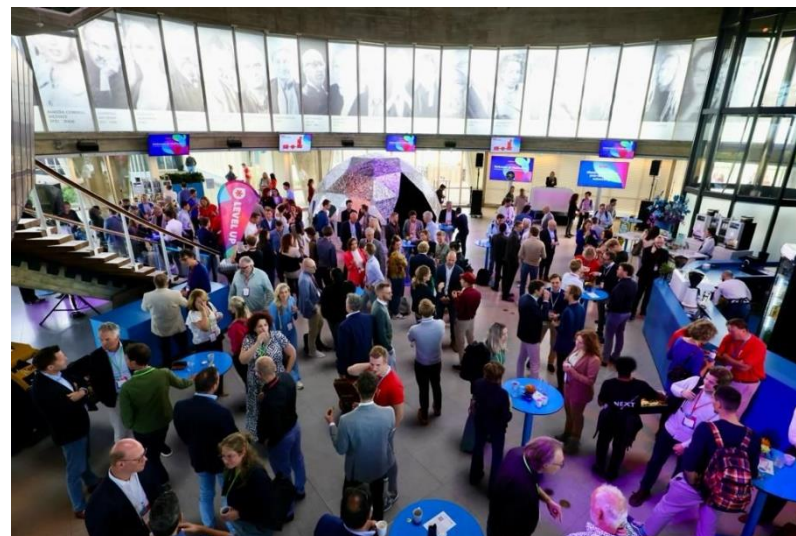
Afbeelding: Braventure Startup-event Level Up, oktober 2023, Evoluon Eindhoven