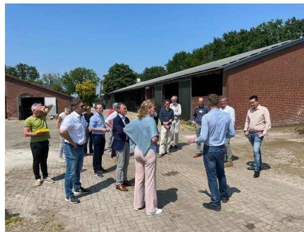
Afbeelding: Bezoek vanuit Ministeries LNV en EZK aan deelnemer Agroproeftuin de Peel

verduurzaming en digitalisering, innovatie-ecosysteemontwikkeling, innovatieprogramma's en de rol en positie van de triple helix samenwerking hierbij. Ook zal in 2024 op het thema landelijk gebied en transitie landbouw en het verkrijgen van gewenste inzet vanuit het Rijk de nodige aandacht krijgen. Daar waar zinvol doen we dit in samenwerking met RNOB of andere samenwerkingspartners.