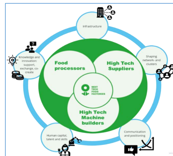
Figuur: Activiteiten en Focusgebieden Next Tech Food Factories