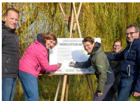
Afbeelding: samenwerking HAS Green Academy en Avans op Kleine Aarde in Boxtel

Een speerpunt hierbinnen zijn de bewoners van de kwetsbare wijken en kernen in Noordoost-Brabant en de 30.000 studenten van deze opleidingen. Het programma wordt in 2024 verder geconcretiseerd en hopelijk ondersteund vanuit een nieuwe regiodeal-honorering in de loop van 2024.