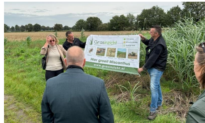
Afbeelding: Teelt van Miscanthus als grondstof voor de bouw op Agroproeftuin de Peel