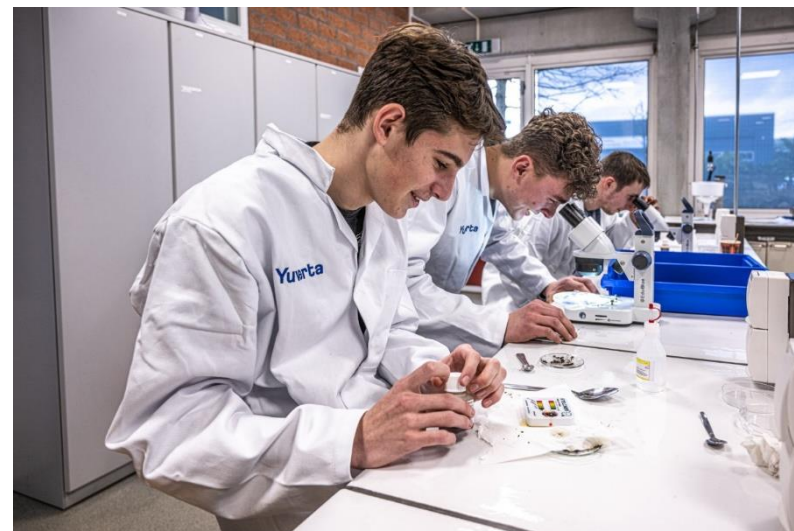
Afbeelding: studenten Yuverta ontdekken en leren vanuit Practoraat Bodem, Boxtel