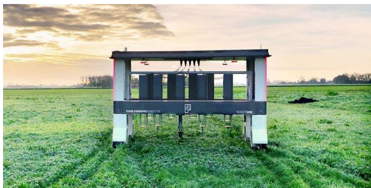
Afbeelding: AgriFood Innovation ondersteunt innovaties voor een slimme landbouw

De AFI-doelstellingen sluiten nauw aan bij de Brabantse Innovatieagenda Landbouw & Voedsel 2021-2030. We werken aan versterking van de agrifood community door bijeenkomsten en communicatie.