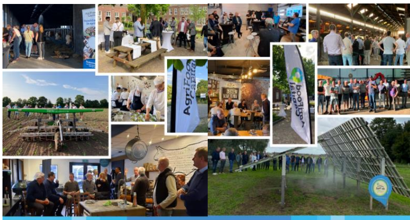
Afbeelding: compilatie 'AgriFood Capital in bedrijf' met gemeenteraden 2023