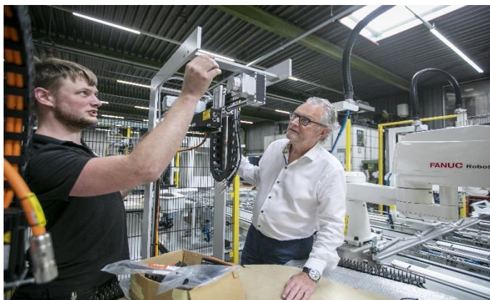
Afbeelding: ontwikkeling co-bots voor bakkerij (NextGen High Tech)