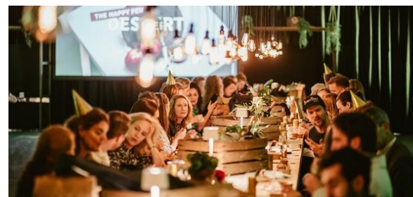
Afbeelding: Bijeenkomst bekendmaking Food100 Foodhelden 2022