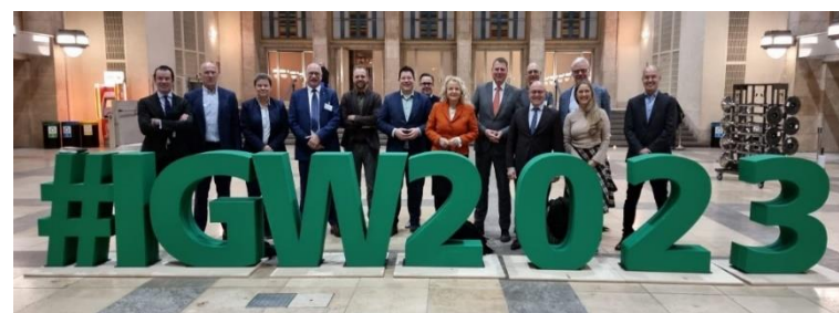
Afbeelding: Bezoek aan Grüne Woche 2023 samen met provincie Noord-Brabant

Drie Nederlandse voedselregio's: Greenport Regio Venlo, AgriFood Capital Noordoost-Brabant en Regio Foodvalley, opereren samen als FoodNL. De gezamenlijke thema's zijn voeding & gezondheid en eiwittransitie. We werken er samen aan om de kracht van dit agrifood-innovatie ecosysteem beter zichtbaar te maken. In 2023 hebben we vooral gewerkt aan het realiseren van contacten met relevante partners in de EU. We gebruiken daarvoor internationale podia zoals de European Week of Regions and Cities en de Grüne Woche in Berlijn.