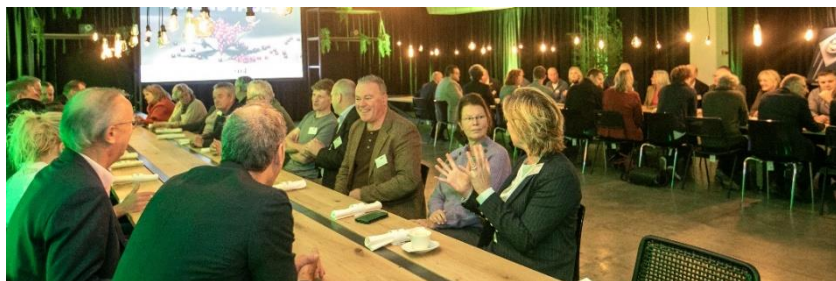
Afbeelding: Netwerkbijeenkomst AgriFood Capital 2022

Een keer per jaar brengen we het publieke en private leiderschap in Noordoost-Brabant bij elkaar. Het centrale thema is leiderschap, omdat dit een belangrijk aspect is in succesvolle regionale ecosystemen. De 11 burgemeesters nodigen verschilmakers uit hun gemeenten uit, om deel te nemen aan de meest bijzondere lunch van het jaar. Het event kent drie pijlers; een unieke setting, bijzondere personen en actuele inhoud. We streven ernaar om dit event uit te laten groeien tot het meest bijzondere ontbijt van het jaar in Noordoost-Brabant, dat plaatsvindt op de laatste vrijdag van november.