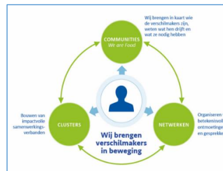
Figuur: Focus netwerkontwikkeling en Anker-events

We gaan actief op zoek naar samenwerkingskansen bij koplopers en helpen ze bij het vormgeven van de samenwerking. In 2024 zullen we ons daarbij vooral richten op de cross-over agrifood (Next Tech Food Factories) en op kringlooplandbouw (AgroProeftuin de Peel).